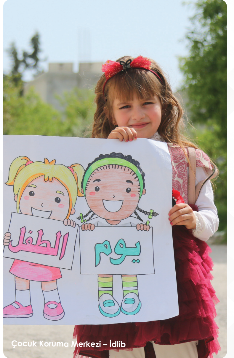
Çocuk Koruma Merkezi – İdlip