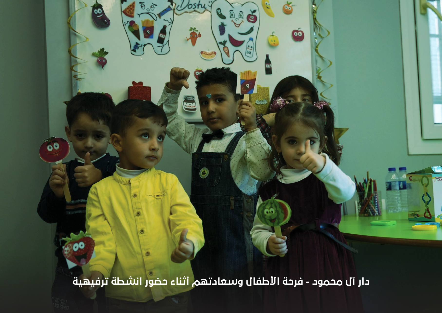
دار آل محمود - فرحة الأطفال وسعادتهم أثناء حضور انشطة ترفيهية