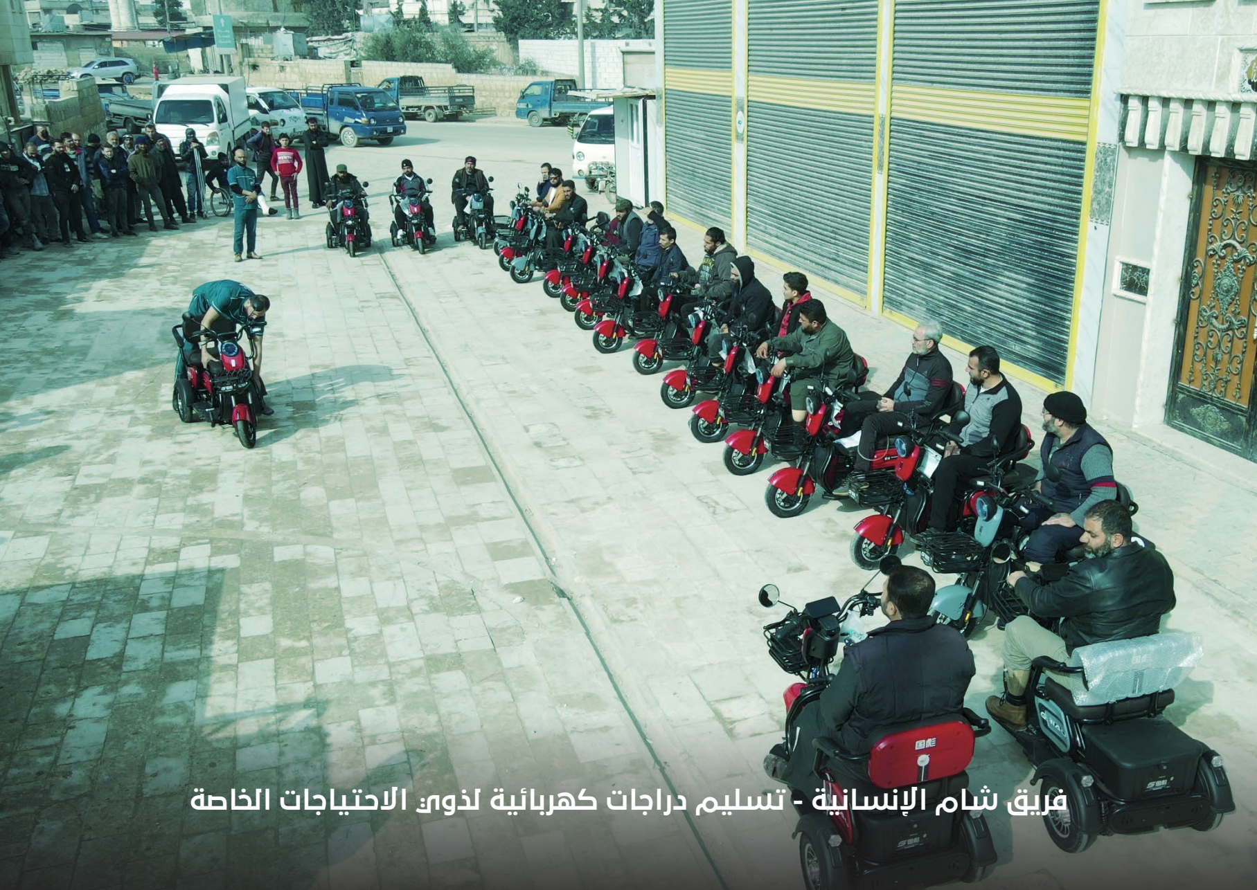
فريق شام الإنسانية - تسليم دراجات كهربائية لذوي الاحتياجات الخاصة